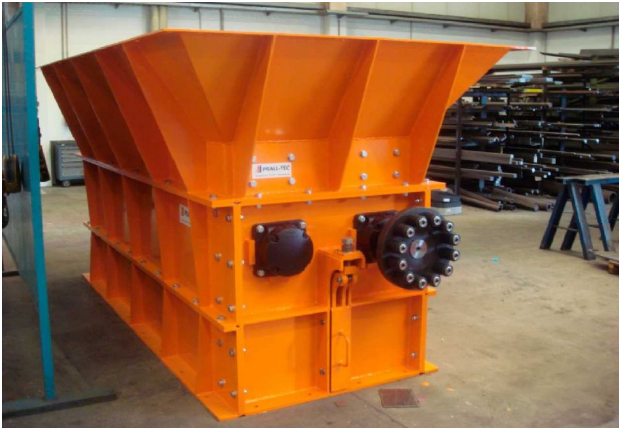
2 Wellen Schredder PTG 2 zur Autoglaszerkleinerung

Генеральный Представитель и Дилер PRALL-TEC GMBH ( www.prall-tec.de )