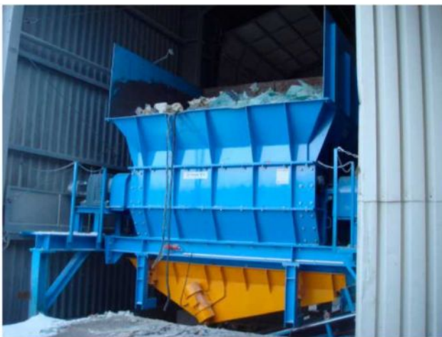
Vorzerkleinerung von Autoscheiben

Предварительного измельчения автомобильных окон